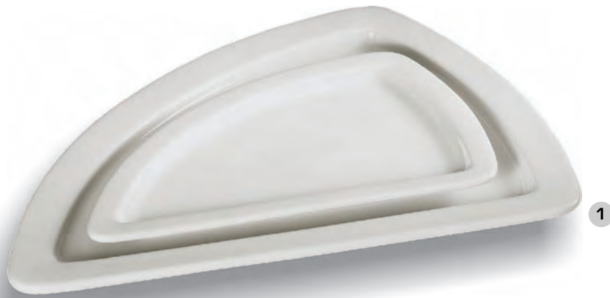
P EOLE 270 x 370 cm