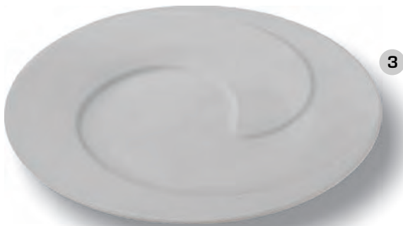
diamètre 32 mm