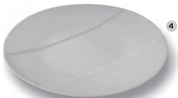
diamètre 32 mm