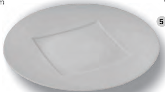
diamètre 30 mm et 32 mm